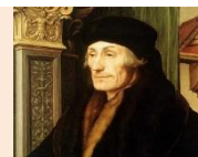
Erasmus de Rotterdam

En suma, sin la locura no hay relación humana posible y mucho menos sólida y agradable; sin mí el pueblo no soportaría al príncipe, ni el siervo a su señor, ni la sirviente a su dueña, ni el discípulo a su preceptor, ni el amigo al amigo, ni el marido a la mujer, ni el alojado al huésped, ni el compañero al compañero, ni el convidado al anfitrión se sufrirían; es necesario que todos se engañen, se adulen, se soporten con exquisita prudencia y se unten recíprocamente con la miel de la sandez.