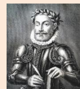
Luis de Camões

Las armas y varones distinguidos, Que de Occidente y playa Lusitana Por mares hasta allí desconocidos, Pasaron más allá de Taprobana; Y en peligros y guerra, más sufridos De lo que prometía fuerza humana, Entre remota gente, edificaron Nuevo reino, que tanto sublimaron: