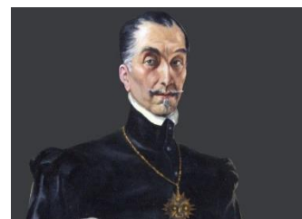
Garcilaso de la Vega

Fue el género que más se utilizó en esta época. La principal novedad formal en la poesía es el empleo del verso endecasílabo combinado, en ocasiones, con el heptasílabo , con los que se crean las estrofas más significativas del Renacimiento: el soneto , la lira , y la octava real . De todos ellos, el principal es el soneto, que es una estrofa de catorce versos endecasílabos con rima consonante distribuidos en dos tercetos y dos cuartetos con esquema métrico ABBA ABBA CDE CDE.